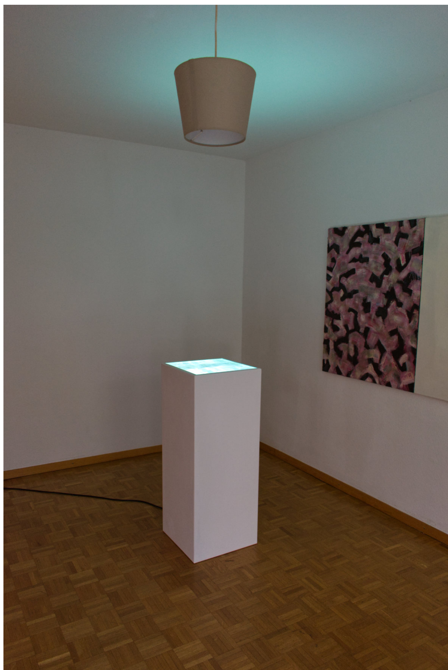
Linda Wunderlin, The Cypress is like the Ghost of a dead Flame, 2022, Courtesy the artist, © Linda Wunderlin