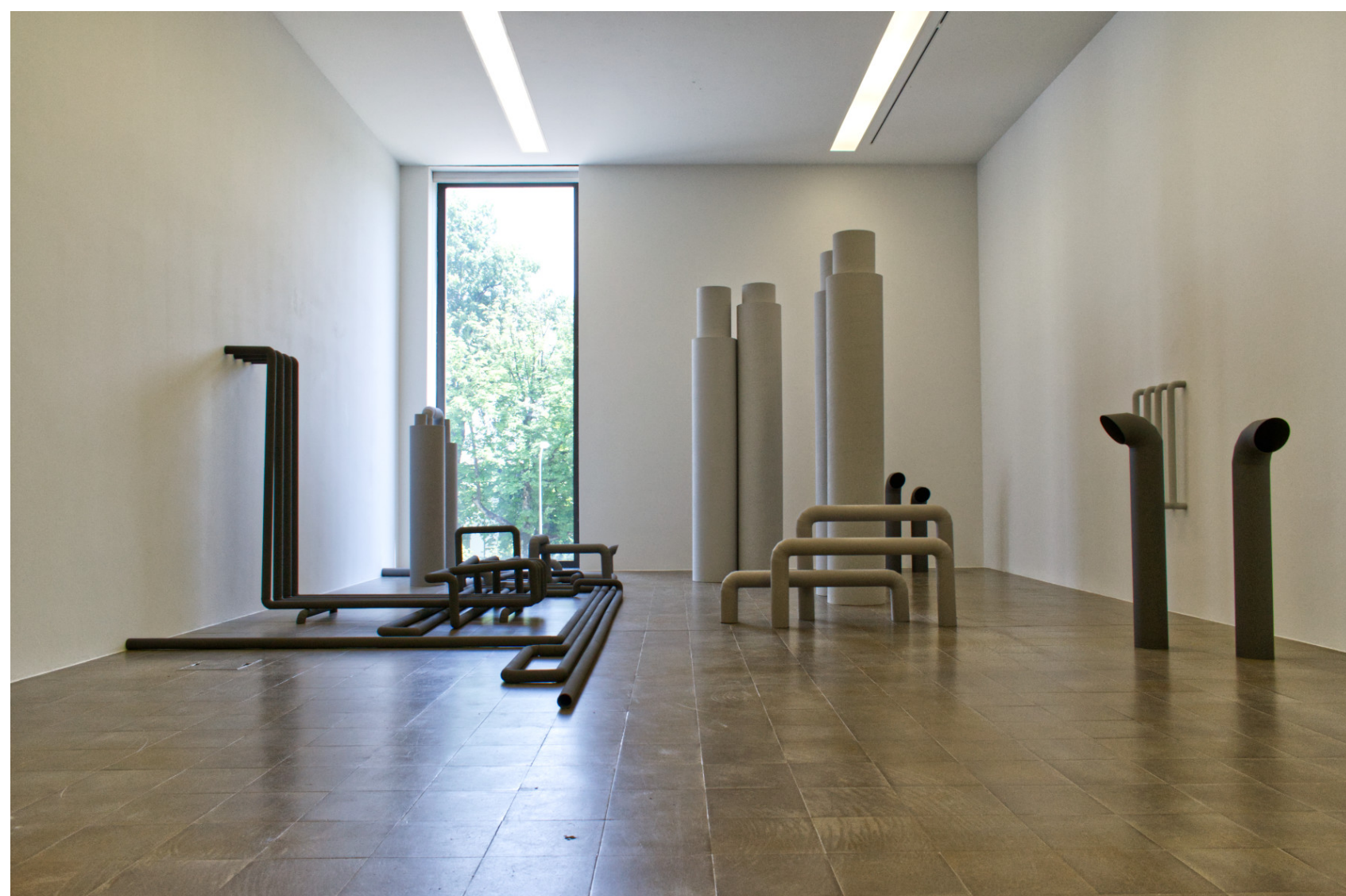
Linda Wunderlin, Zonen ästhetischer Kausalität, 2022