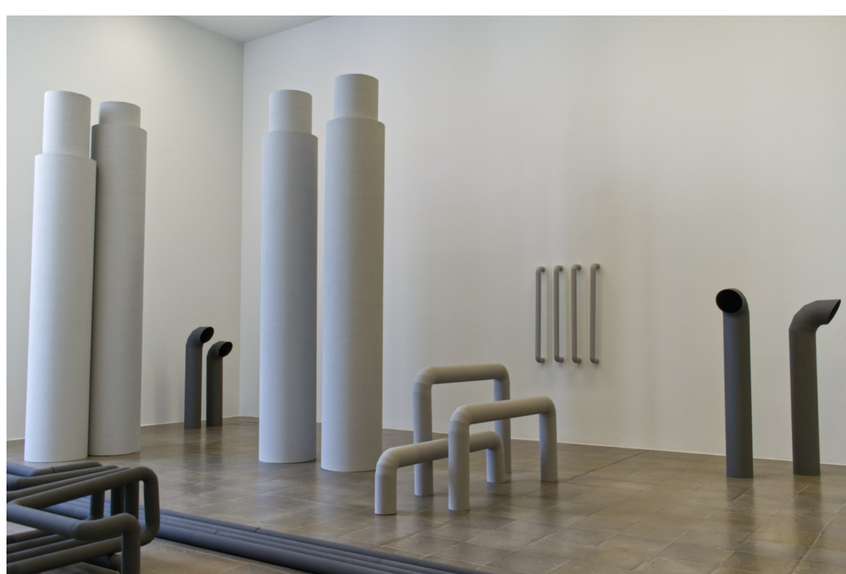
Linda Wunderlin, Zonen ästhetischer Kausalität, 2022

— Cantonale Berne Jura Kunsthaus Langenthal, 7.12.2023 bis 14.1.2024 cantonale.ch